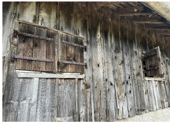
Façades en bois

Lors des dernières tournées des montagnes, il a été constaté que les tavillons des pignons Nord-Est et Nord-Ouest ainsi que la totalité du pan Sud étaient en très mauvais état. De plus, les façades en bois, y compris les portes et volets, sont également vieillissantes. Cette situation est due à l'âge des différents matériaux ainsi qu'à leur exposition aux conditions météorologiques les plus diverses.