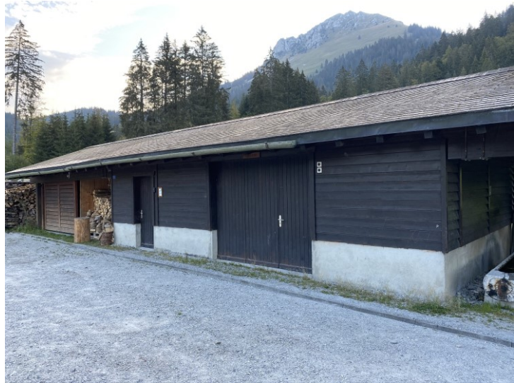
Bâtiment no°792A où seront installés la nouvelle chaudière et le silo