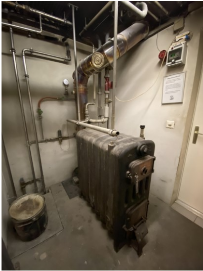
Chaudière à bois actuelle