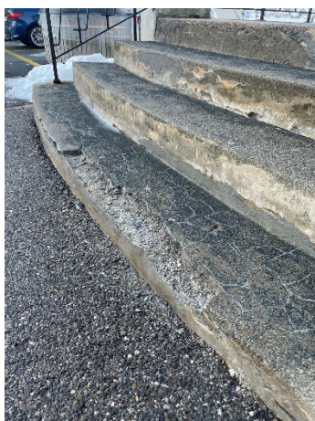
Maçonnerie escaliers situation actuelle

Les travaux concernant l'escalier ainsi que la porte principale devront être validés par le Service des biens culturels.