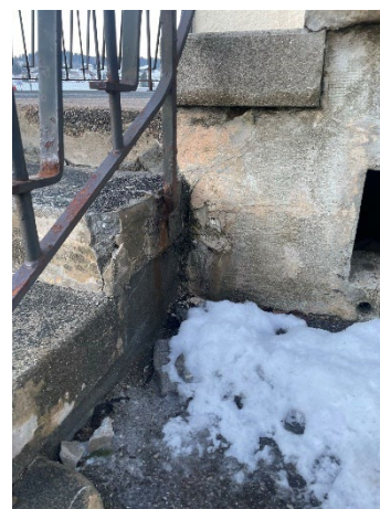
Maçonnerie escaliers situation actuelle