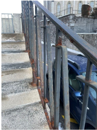
Barrière escaliers situation actuelle