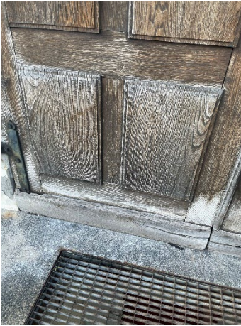
Porte principale situation actuelle