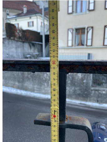
Barrière escaliers Hauteur ne correspond plus aux normes actuelles