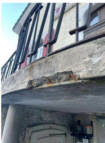
Maçonnerie escaliers situation actuelle