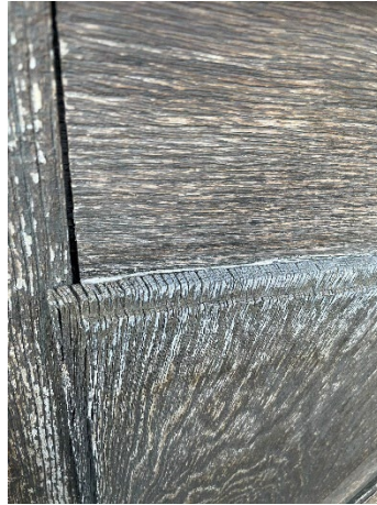
Porte principale situation actuelle