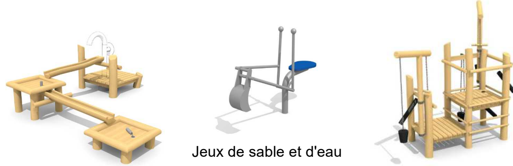
Jeux de sable et d'eau