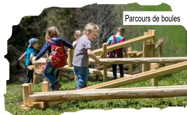
Parcours de boules