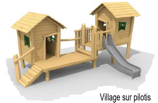
Village sur pilotis