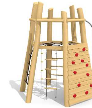
Jeux de grimpe