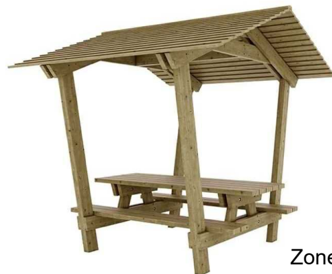
Zone de pique-nique